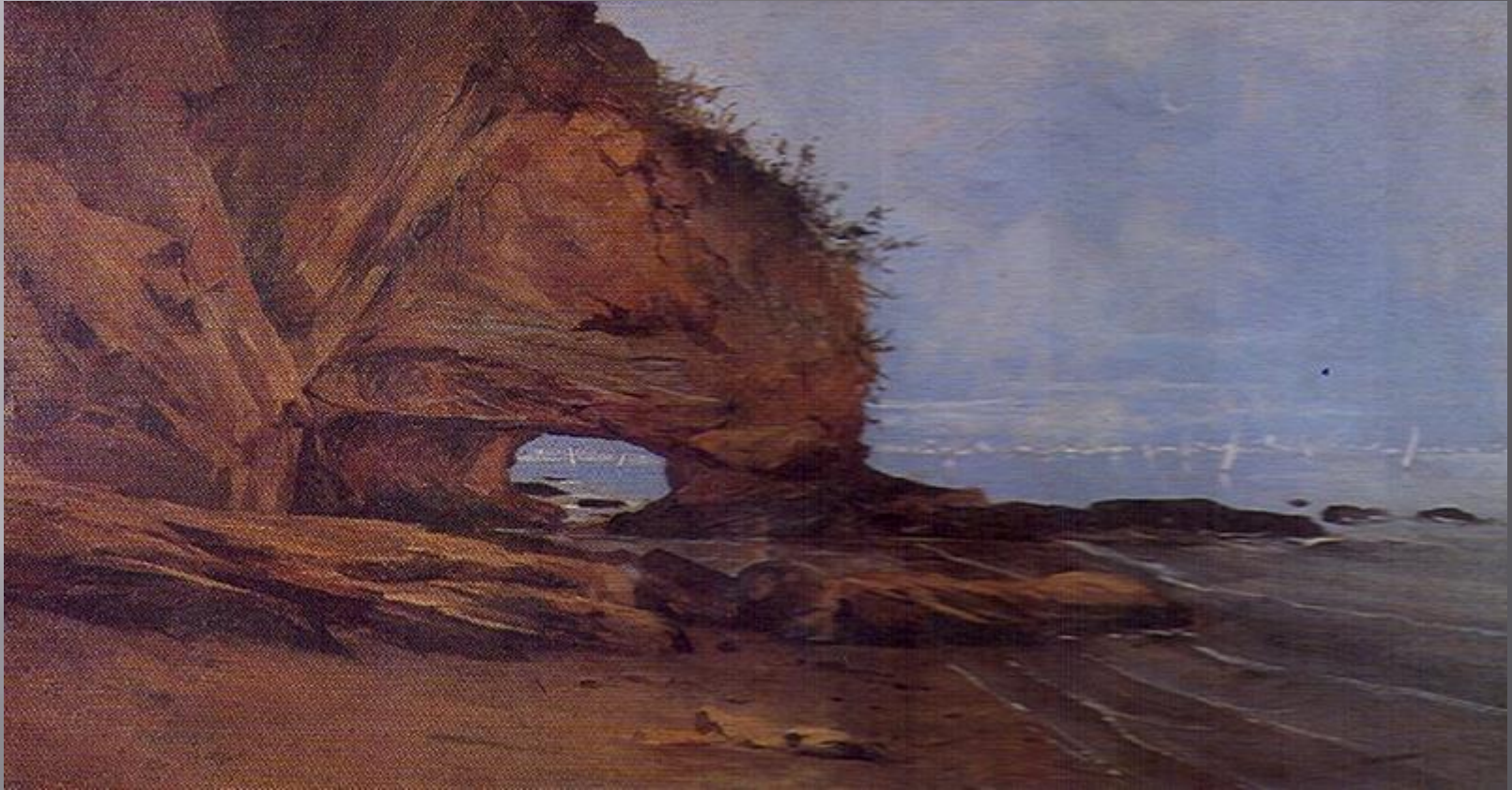
Imagem 3 – Pedra de Itapuca, Antonio Parreiras, 1891.