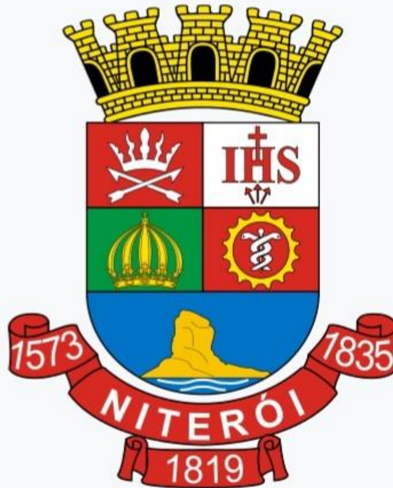
Imagem 6 – Brasão da cidade de Niterói.

https://leismunicipais.com.br/prefeitura/rj/niteroi