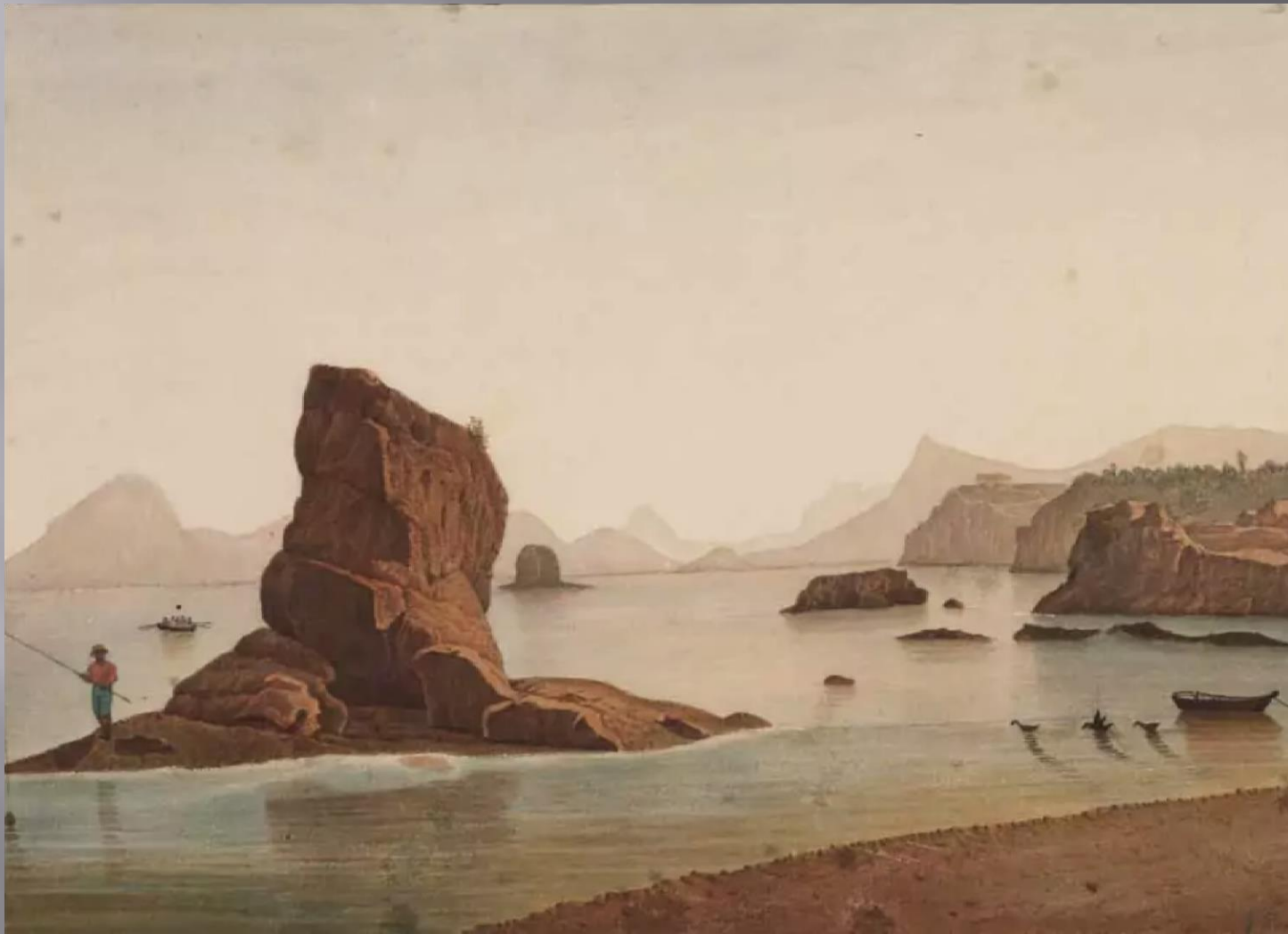
Imagem 4 – Pesca entre as rochas | 1865 | Jacques Burkhardt | Coleção: Museum of Comparative Zoology, Harvard University, Cambridge