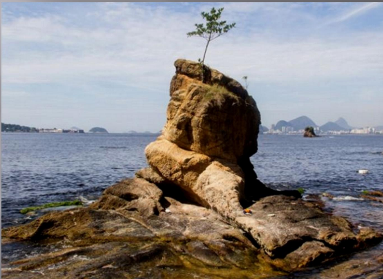
Imagem 1 - Pedra de Itapuca. Foto: Leo Zulluh, 2013. Tombamento estadual - Processo INEPAC E-03/33