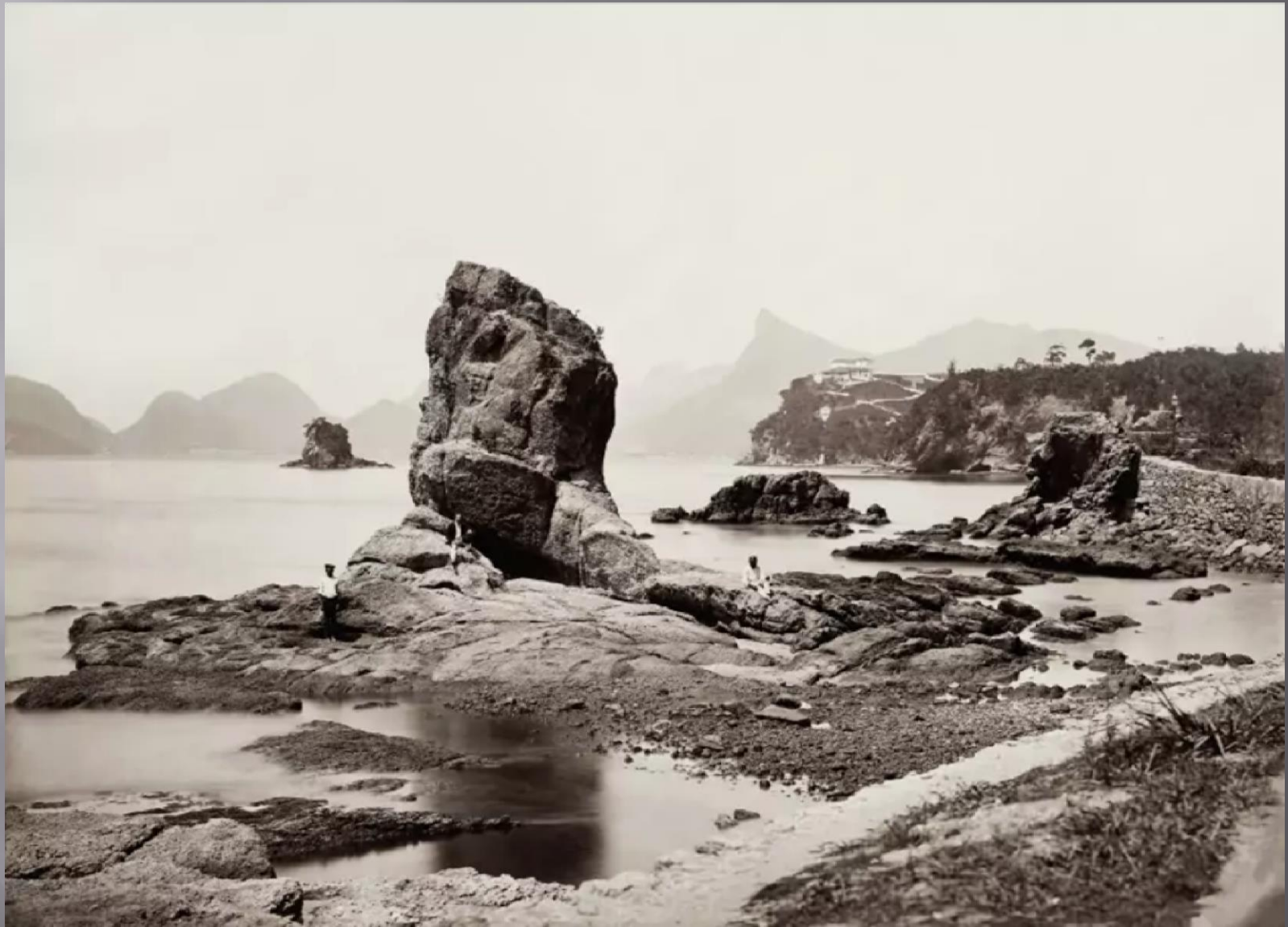
Imagem 5 – Pedra de Itapuca | C..1876 | Marc Ferrez | Coleção: Instituto Moreira Salles. Fonte: www.mostradarwin.com.br